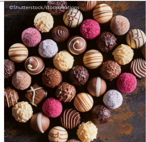
Ausgewählte Fette für feinste Confiserie-Produkte

Als Ersatz für Palmöl eignet sich als strukturgebende Basis Kakaobutter oder Kokosfett, aber auch das heimische Rapsöl, das komplett gehärtet wird ohne Transfette zu bilden. Jedes Schokoladenprodukt hat andere technologische und organoleptische Anforderungen, daher erarbeitet das Nutriswiss-Team gemeinsam mit dem Kunden die passende Alternativformulierung. Mit viel Erfahrung und modernem Equipment gelingt die einfache Kristallisation für Füllfette, die als ebenbürtige Partner der Schweizer Schokolade ein perfektes Schmelzverhalten aufweisen, ohne sie geschmacklich zu überdecken. Das Vermeiden von Fettreif ist selbstverständlich, genauso wie die Verwendung hochwertiger Rohstoffe. Diese werden beim Schweizer Marktführer für Bio- und Spezialeisöle gereinigt, modifiziert und veredelt. Ein ausgeklügeltes Sourcing und langjährige Kontakte in der ganzen Welt sind dabei die Grundlage für Fettkomponenten in höchster Qualität.